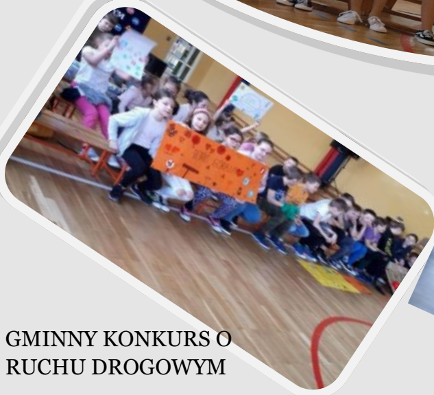
GMINNY KONKURS O RUCHU DROGOWYM